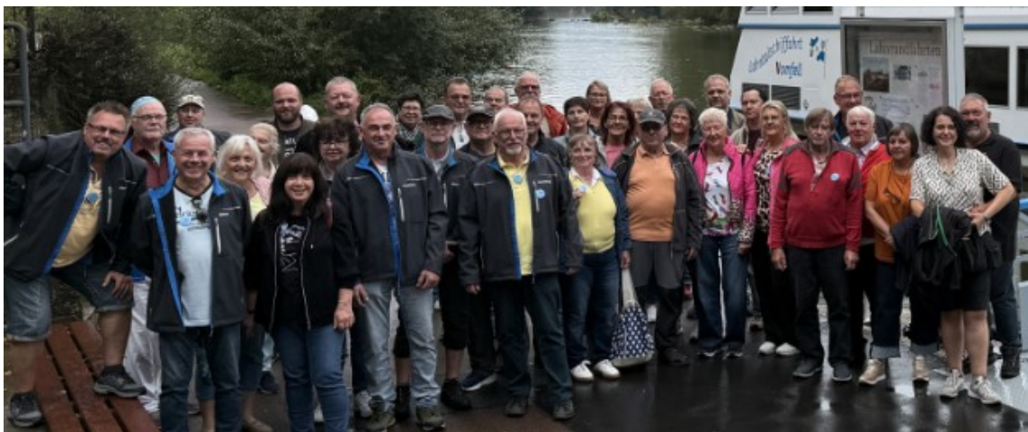
Ein wunderschöner Ausflug nach Düsseldorf wurde durchgeführt