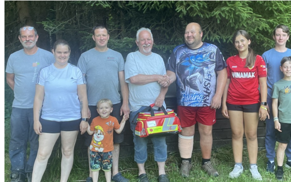
Beim Abendangeln wurde die gespendete Erste Hilfe Tasche übergeben.