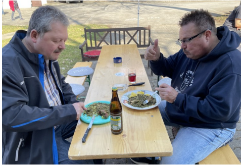
Der Grünkohl war wieder sehr lecker