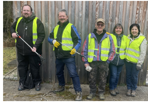
Beim Landschaftsputz gab es wieder viel Spaß