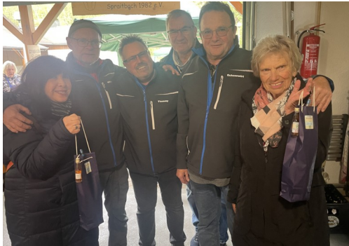
Beim Anfischen herrschte gute Stimmung