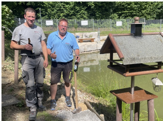
Auch an die Wildvögel wurde bereits im Sommer gedacht