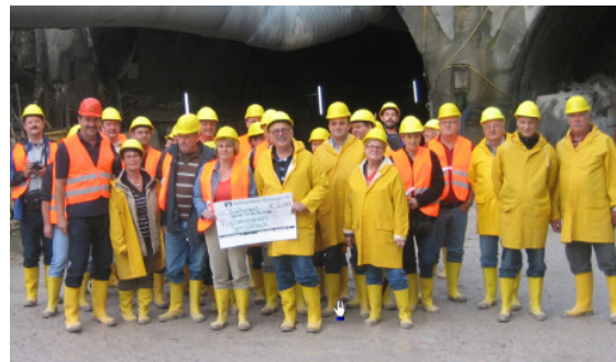
Sie fand auch im Regen statt - Die Tunnelbesichtigung in Schwäbisch Gmünd