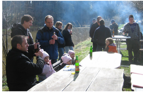
Das Anfischen – Wie immer ein Ereignis am Karfreitag