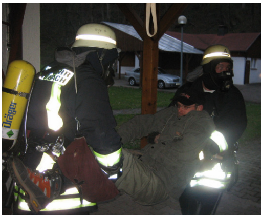
Feuerwehrrübung an der Fischerklause – Der Gewässerwart wurde geborgen.