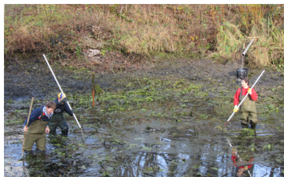
Der Hagenbucheich wurde abgelassen- Die wuchernden Teichrosen sind schuldig