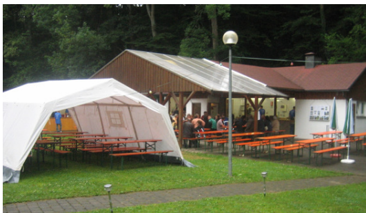
Fischerfest 2010 im Regen - Am Samstag waren die Bänke leer.